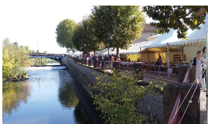
Journées La Quintinie 2023 – Au bord de la Vienne

Remarque : à l'époque, j'ai fourni des greffons de cette variété au Potager du Roy (ENSP de Versailles), qui était également partenaire de Chabonais en l'occurrence, où cette variété pourrait être observée et évaluée (jusqu'à elle n'avait pratiquement pas été multipliée).