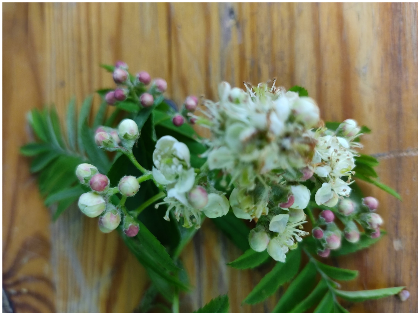
fleurs de cormier