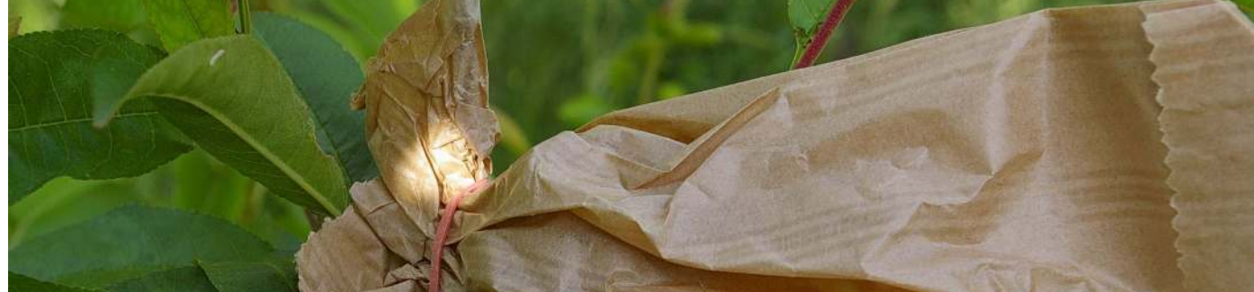
ENSACHAGE-1ère Etape Préparer les sacs préalablement à l'ensachage des fruits (2è étape)