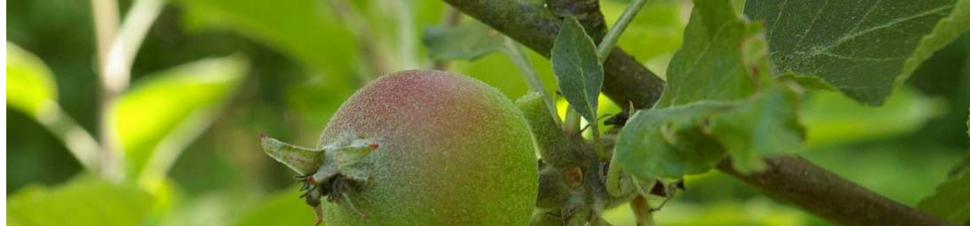
ENSACHAGE-1ère Etape Préparer les sacs préalablement à l'ensachage des fruits (2è étape)