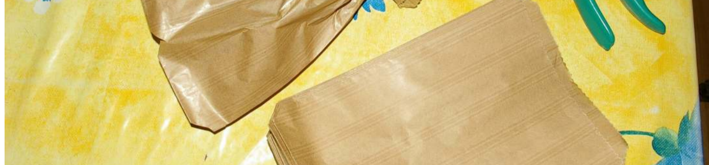
ENSACHAGE-1ère Etape Préparer les sacs préalablement à l'ensachage des fruits (2è étape)