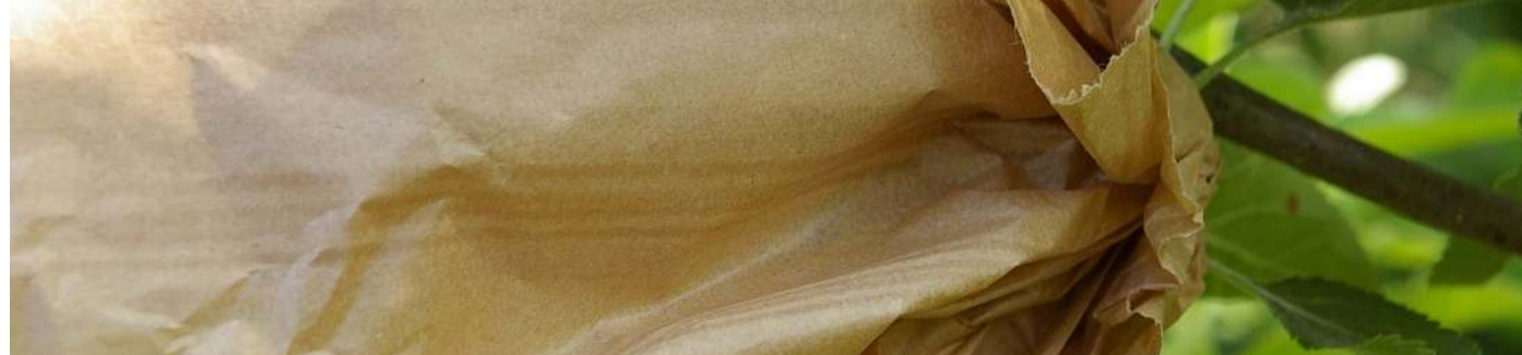
ENSACHAGE-1ère Etape Préparer les sacs préalablement à l'ensachage des fruits (2è étape)