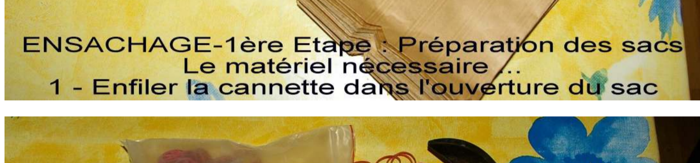
ENSACHAGE-1ère Etape : Préparation des sacs Le matériel nécessaire ... 1 - Enfiler la cannette dans l'ouverture du sac