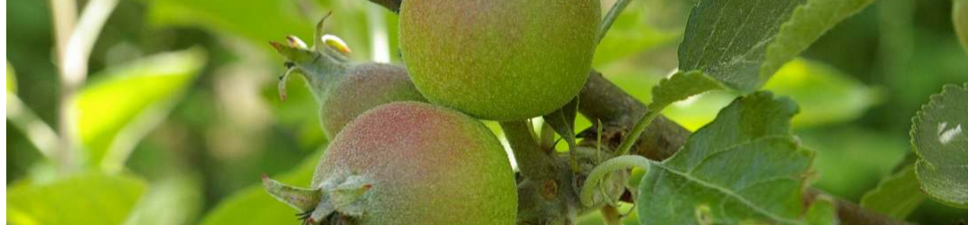
ENSACHAGE-1ère Etape Préparer les sacs préalablement à l'ensachage des fruits (2è étape)