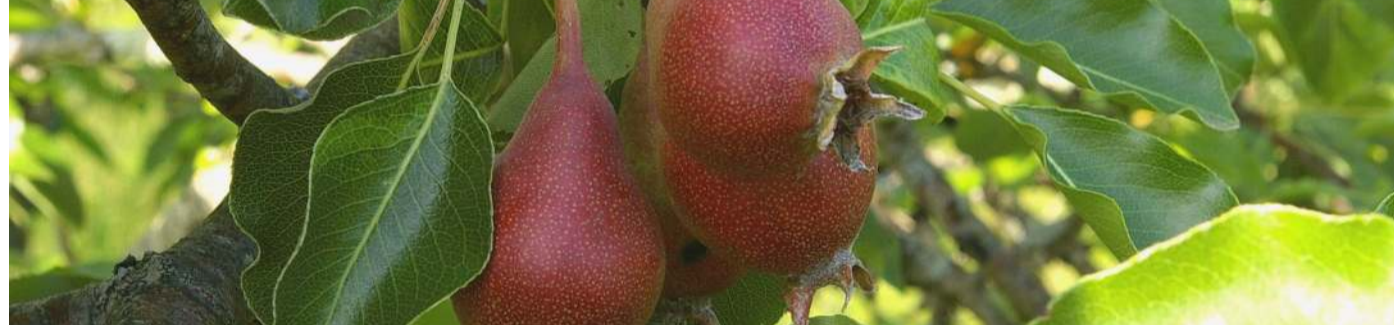
ENSACHAGE-1ère Etape Préparer les sacs préalablement à l'ensachage des fruits (2è étape)