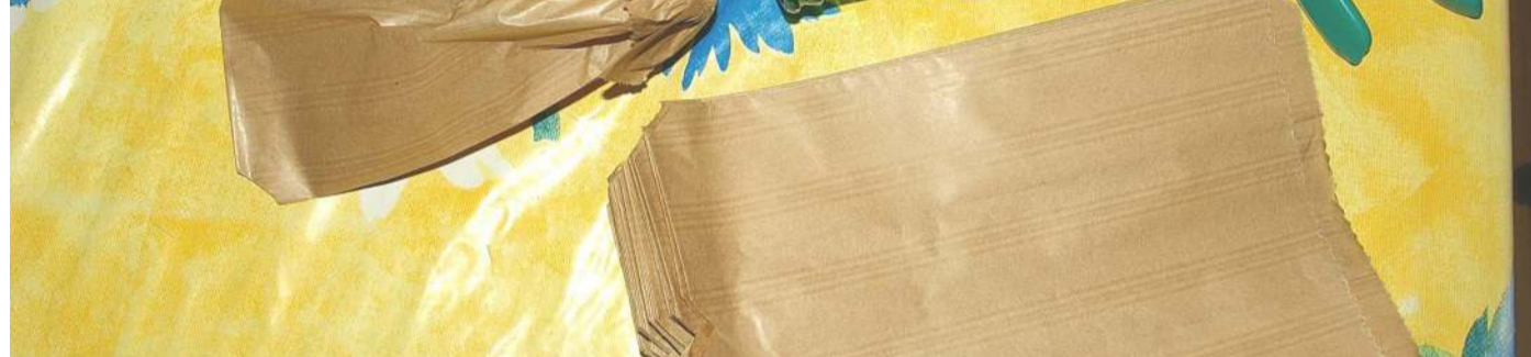
ENSACHAGE-1ère Etape Préparer les sacs préalablement à l'ensachage des fruits (2è étape)