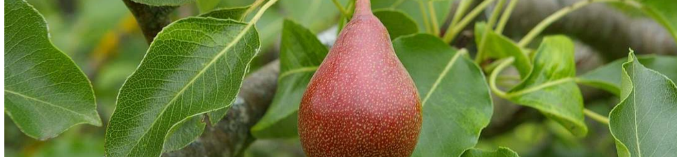
ENSACHAGE-1ère Etape Préparer les sacs préalablement à l'ensachage des fruits (2è étape)