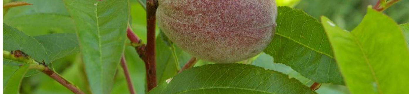
ENSACHAGE-1ère Etape Préparer les sacs préalablement à l'ensachage des fruits (2è étape)