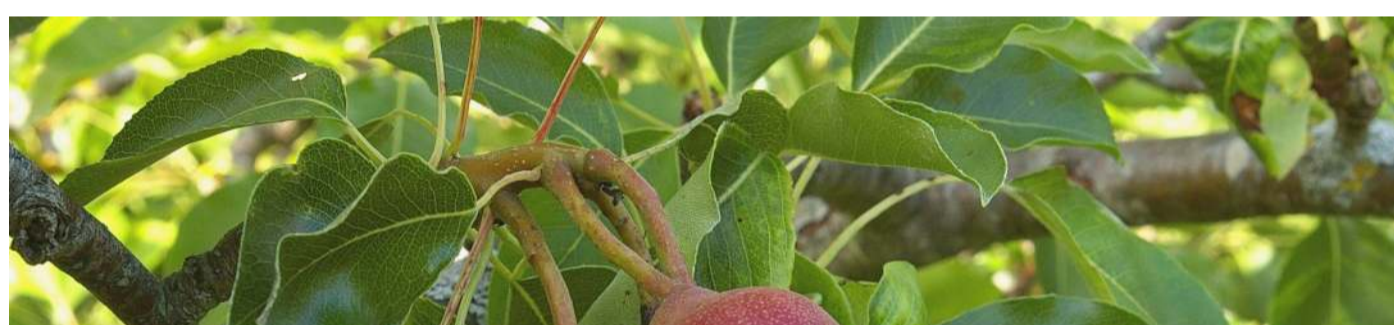
ENSACHAGE-1ère Etape Préparer les sacs préalablement à l'ensachage des fruits (2è étape)