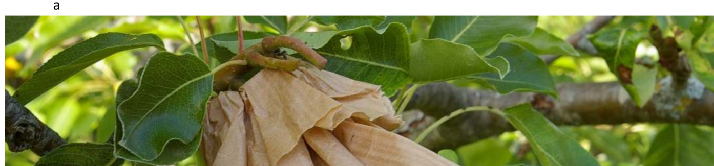
ENSACHAGE-1ère Etape Préparer les sacs préalablement à l'ensachage des fruits (2è étape)