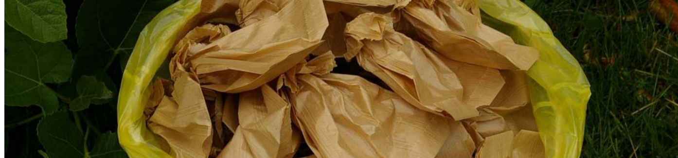
ENSACHAGE-1ère Etape Préparer les sacs préalablement à l'ensachage des fruits (2è étape)