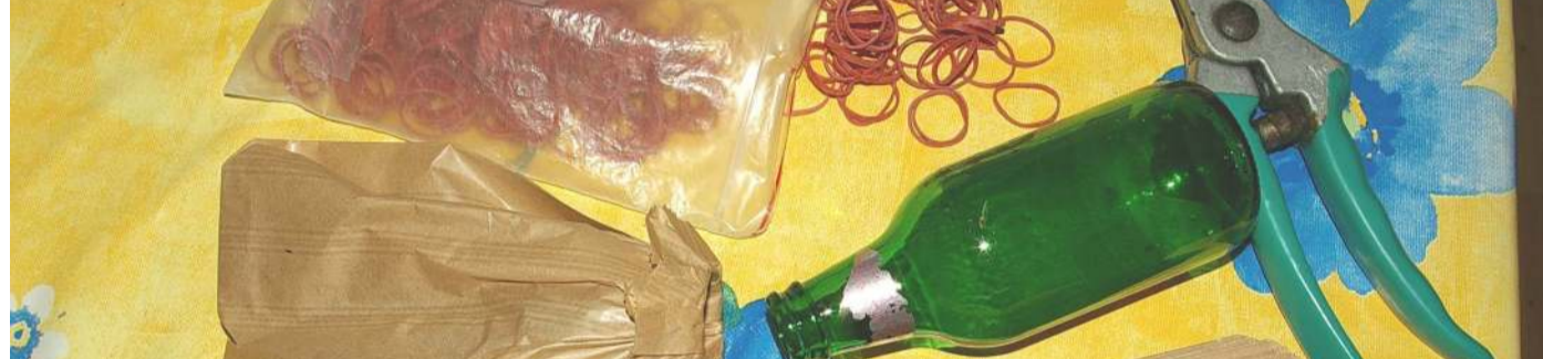
ENSACHAGE-1ère Etape Préparer les sacs préalablement à l'ensachage des fruits (2è étape)