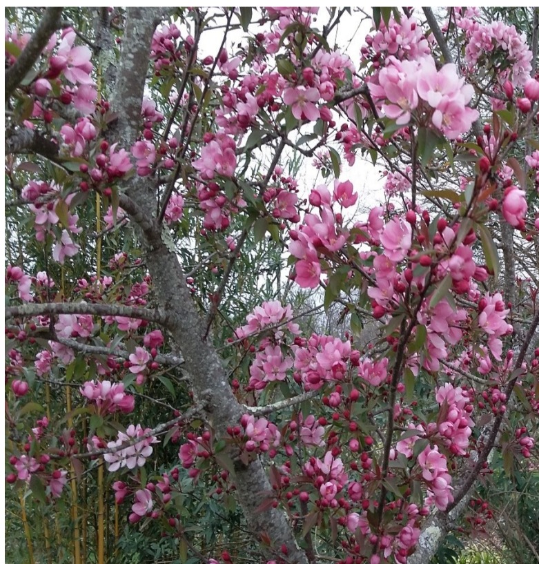
La floraison précoce du « pommetier » 'Makamik'