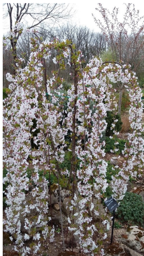
La floraison du prunus 'Snow Fountain' un cerisier décoratif au port naturellement pleureur