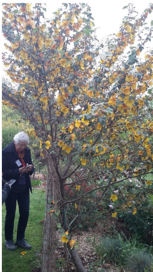
L'incroyable floraison du Frémontodendron le 27 avril On prend des notes !